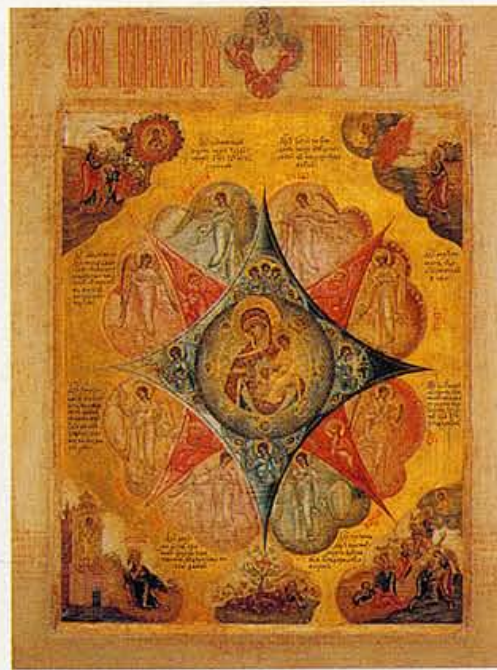
Moeder Gods van het brandende braambos, 18de eeuw, 10 jaar geleden €7.500 en maart 2004 €14.000.

Op de vraag of het moeilijk is om het productiejaar van een icoon te achterhalen, zegt de expert: 'Het dateren van een icoon vereist veel ervaring. Je moet veel vergelijkingsmateriaal, honderden iconen, gezien hebben om te weten waar je op moet letten. Juist als er bij zo'n aangeboden icoon documentatie zit, wordt het dubieus. Hoe meer papieren er op tafel worden gelegd om iets als echt te kenmerken, hoe meer je moet