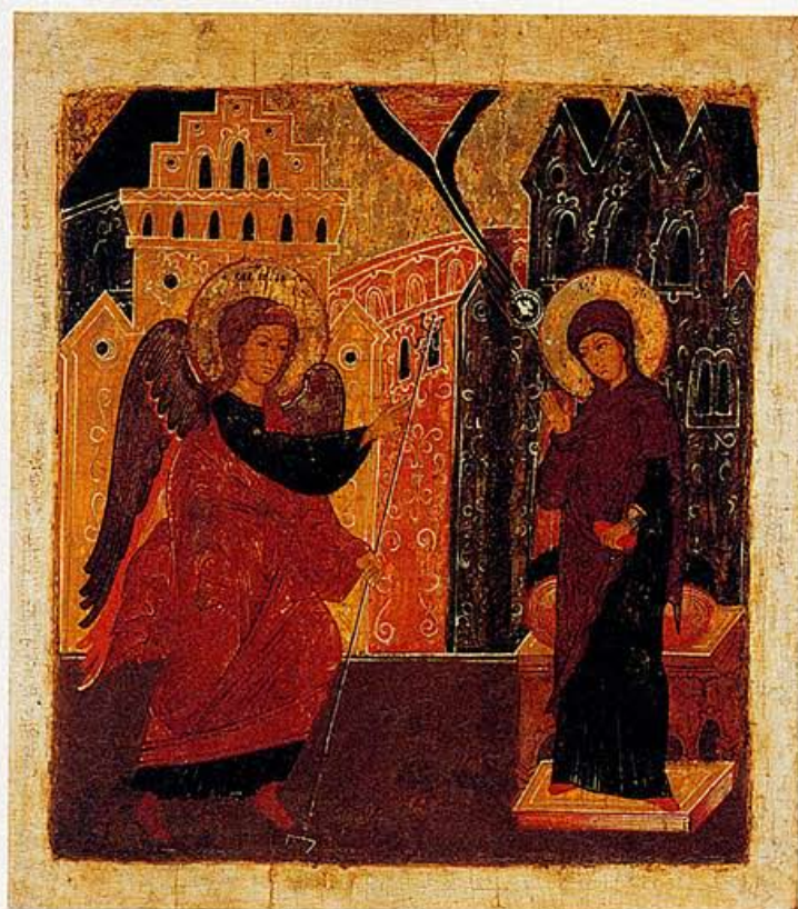
Maria met de engel Gabriël, tweede helft 17de eeuw, 10 jaar geleden €15.000 en maart 2004 €28.000.

Omdat er veel meer vraag is naar Russische antieke iconen dan naar Griekse, is Morsink gespecialiseerd in eerstgenoem-