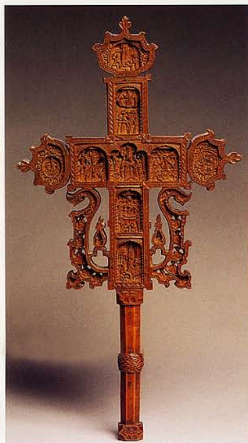
Altaarkruis, cypresenhout, Griekenland (Berg Athos), rond 1700. 39 x 20,2 cm.