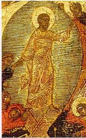
OPSTANDING VAN CHRISTUS (DETAIL IKOON 1)

Ikoon is afgeleid van het Griekse woord eikon , dat 'beeld' of 'gelijkenis' betekent. Maar de ikoon beoogt meer dan uiterlijke gelijkenis, namelijk het weergeven van een deel van het wezen van de afgebeelde figuur, en het zichtbaar maken van een hemelse realiteit. De eerste ikonen werden rond 400 gemaakt en waren enerzijds beïnvloed door de keizersportretten die overal hingen, anderzijds door de Egyptische dodenportretten die twee eeuwen daarvoor in de Fayoem-oase werden gemaakt. De oog- en gelaatsuitdrukking in deze dodenportretten moest weergeven dat de overledene de eeuwigheid aanschouwde. Hierdoor beïnvloed ontstonden de eerste ikonen. De afgebeelde Christusfiguur of heilige werd als aanwezig beschouwd, in de realiteit van het heden en in het perspectief van de eeuwigheid. Die eeuwigheid, de hemelse wereld waarin alles is getransformeerd door het licht van Christus, moest op de ikoon worden afgebeeld.