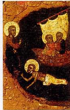
VERSCHEIJNING VAN CHRISTUS MEER VAN TIBERIAS (DETAIL IKOON 1)