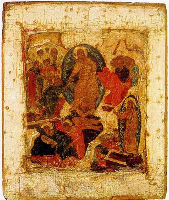
5) ANASTASIS, RUSLAND, 1E HELFT 17E EEUW, HUISIKOON