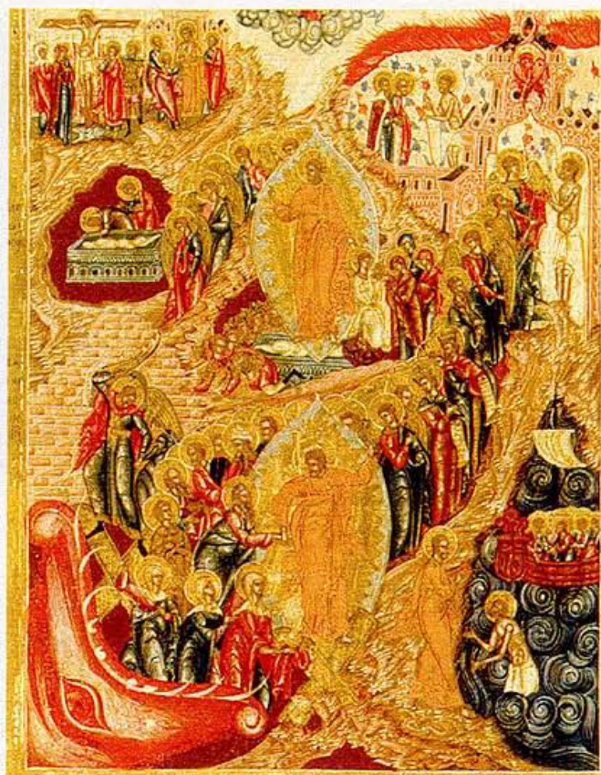
2) FEESTDAGEN IKOON, RUSLAND, PALECH, 19E EEUW

De schoonheid van ikonen zal niemand ontgaan, maar toch zijn deze 'vensters op de eeuwigheid' niet in de eerste plaats bedoeld als kunst. Een ikoon is vóór alles een gebedsmedium. Door te bidden voor een ikoon krijgt de gelovige contact met de afgebeelde figuur en andersom. Voor orthodoxe gelovigen gaat het werkelijk om een venster waardoor tweerichtingsverkeer mogelijk is. De ikoon biedt een direct contact met de hemel dat op elk moment beleefd kan worden, thuis bij de huisikoon of op reis met een reisikoon. Of in de eredienst, waarin ikonen een belangrijke plaats innemen. God en de heiligen zijn voor de gelovigen daadwerkelijk in hun midden. In dat licht is de uitdrukking 'venster op de hemel' makkelijker te begrijpen. →