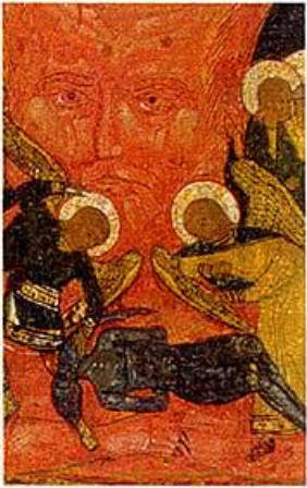
HET GEZICHT VAN HADES EN DE ENGELN RANSELEN DE DUIVEL AF (DETAIL IKOON 3)