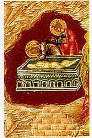
PETRUS BIJ HET LEGE GRAF VAN CHRISTUS (DETAIL IKOON 2)