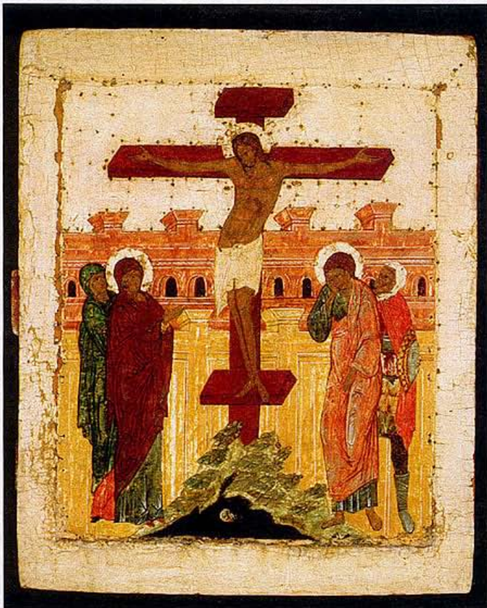
4) KRUISIGING VAN CHRISTUS, RUSLAND, MOSKOU 16E EEUW, KERKIKOON

den ook nooit gesigneerd, al zijn grote ikonenschilders wel te herkennen aan hun 'handschrift' en is er een enorme variatie in stijlen te zien. De afbeeldingen hebben diepte noch natuurlijke verhoudingen; landschappen doen vervreemdend aan en zitten vol symboliek. Alle-