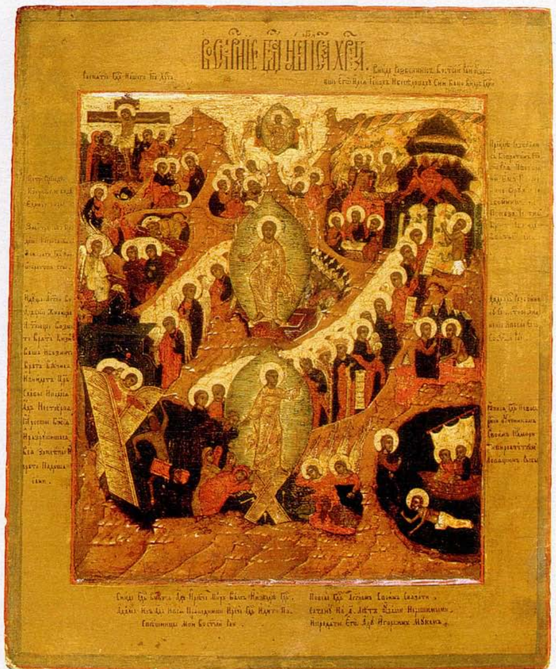
1) ANASTASIS, RUSLAND, ROND 1700, HUISIKOON

Ikonen worden gemaakt door en voor orthodoxe christenen om de hemel uit te beelden. Dus worden er de mooiste, zuiverste materialen voor gebruikt. Voor ons, in het westen, zijn ze vooral mooi. Maar altijd zijn ikonen meer dan zomaar een 'leuk schilderijtje boven de bank'.