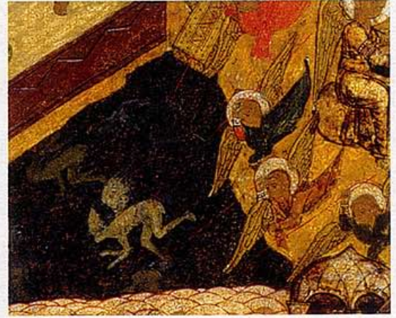
ENGELN PIKKEN DE DUIVEL IN DE KONT (DETAIL VAN IKOON 3)

maal om die andere wereld uit te drukken, een wereld van volmaakte harmonie.