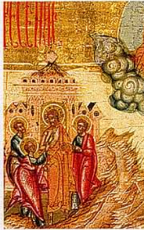
ONGELOVIGE THOMAS (DETAIL IKOON 2)