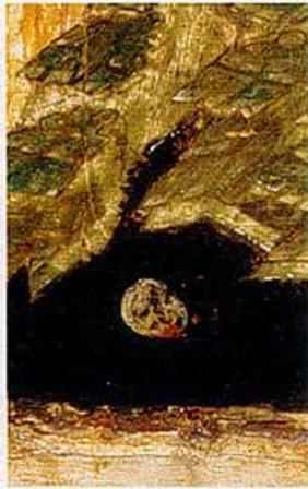
DE SCHEDEL VAN ADAM (DETAIL IKOON 4)